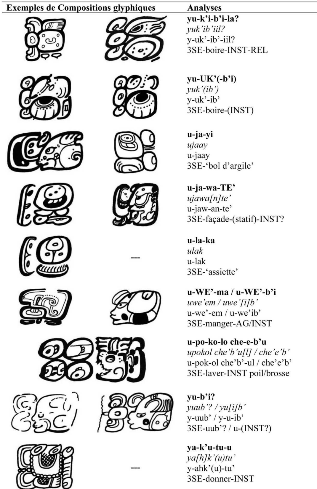
Table I : Glyphes communs mayas Classique sur céramique (dessins Christophe Helmke).